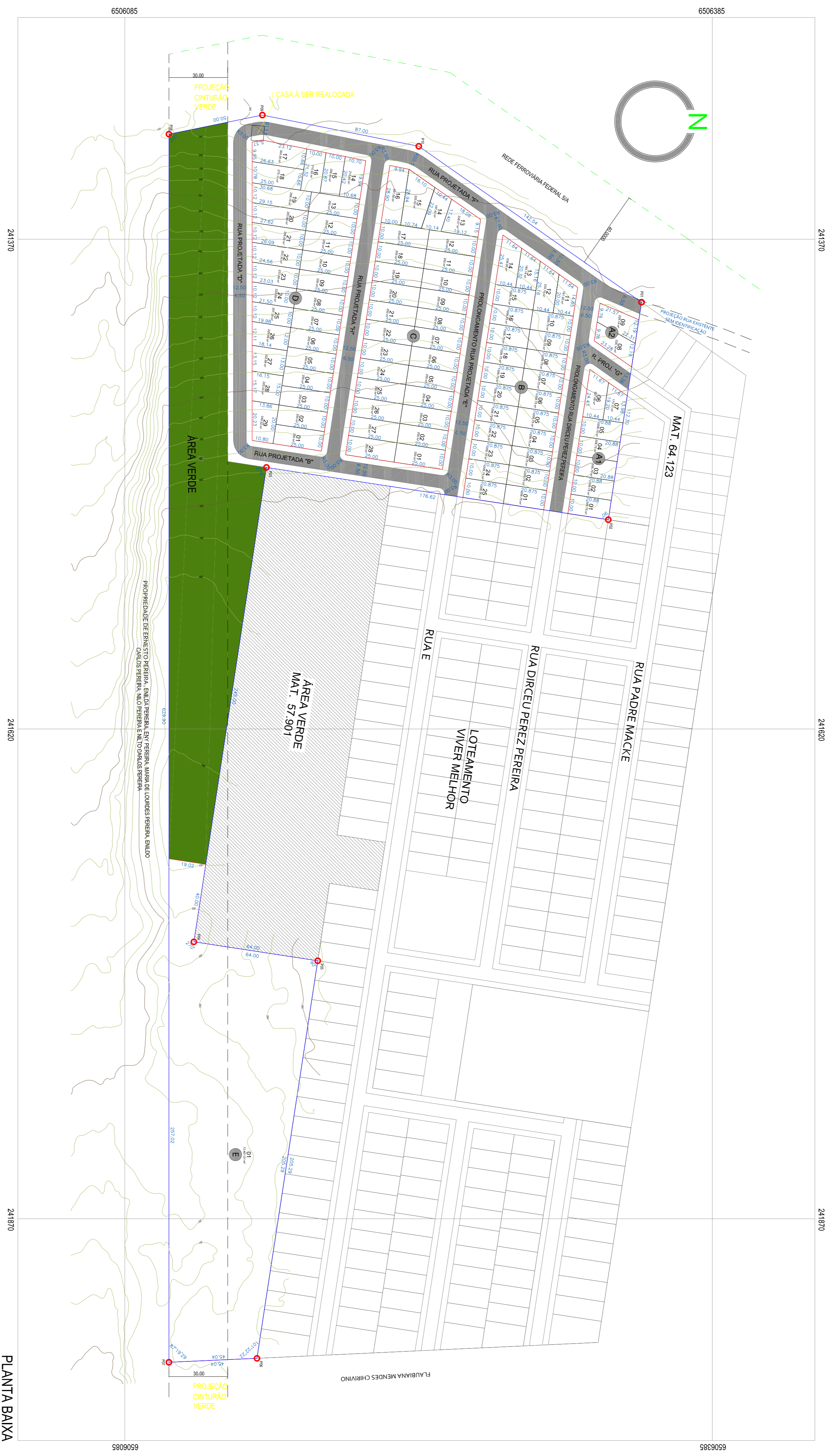
PLANTA BAIXA ESC.: 1/1250